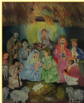
Kordina Vlatka, Koprivnica Božićno čudo, ulje na staklu, 2015.