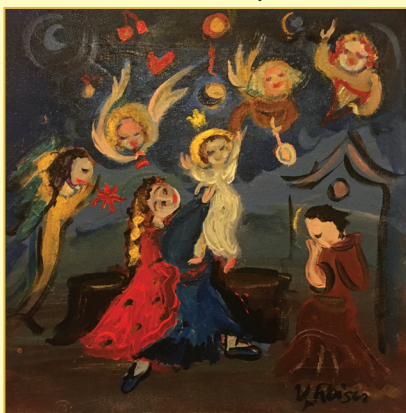
Reiser Vjera, Zagreb - Dobro došao, kralju nebeski, ulje na platnu, 2017.