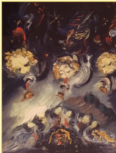
Reiser Vjera, Zagreb Silazak na zemlju, 2006.