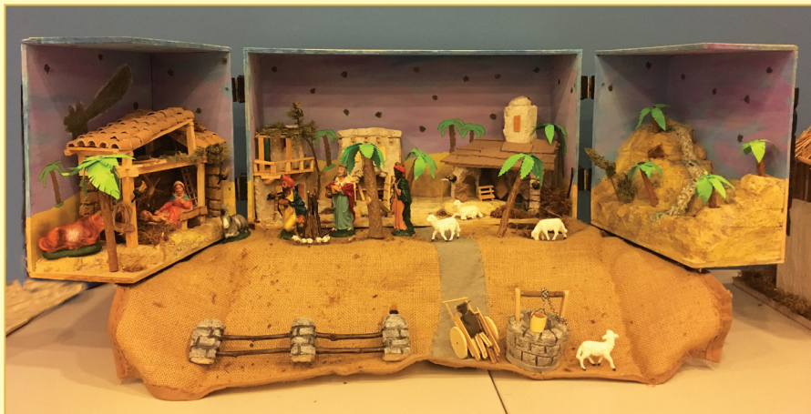
Šimunović Danijel, Zagreb - Tiha božićna noć, šperploča, vodene boje, stiropor, prirodni materijali, 2016.