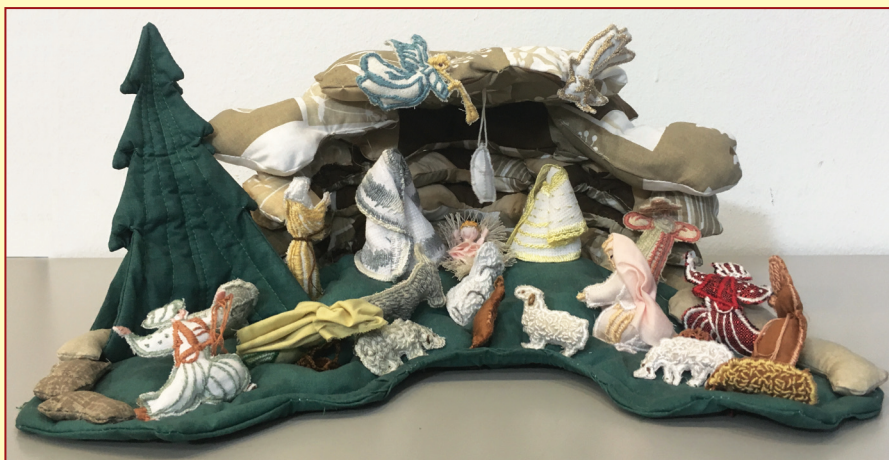
Hajdinjak Marija, Međimurje - Božićne jaslvice od tekstila, vez na platnu, 2015.

Kako je tradicija božićnih jaslvice u Hrvatskoj živa i snažna, jaslvice su tako našle mjesto gotovo ispod svakog božićnog drvca. Odras je to težnji naših ljudi, mnogobrojnih naših obitelji, koji u vrijeme Došašća nastoje poticati izgradnju božićnih jaslvice.