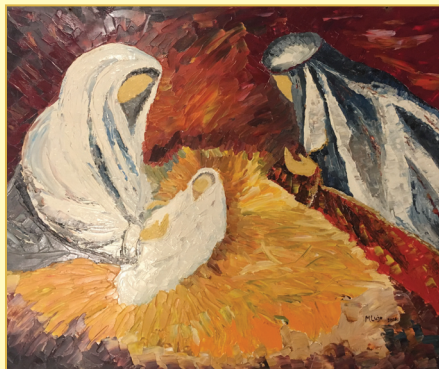
Lujo Marko, Zagreb Sveta obitelj, ulje na lesonitu, 2013.