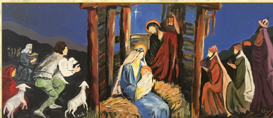
Lujo Marko, Zagreb - Sveta obitelj, ulje na lesonitu, 2013.