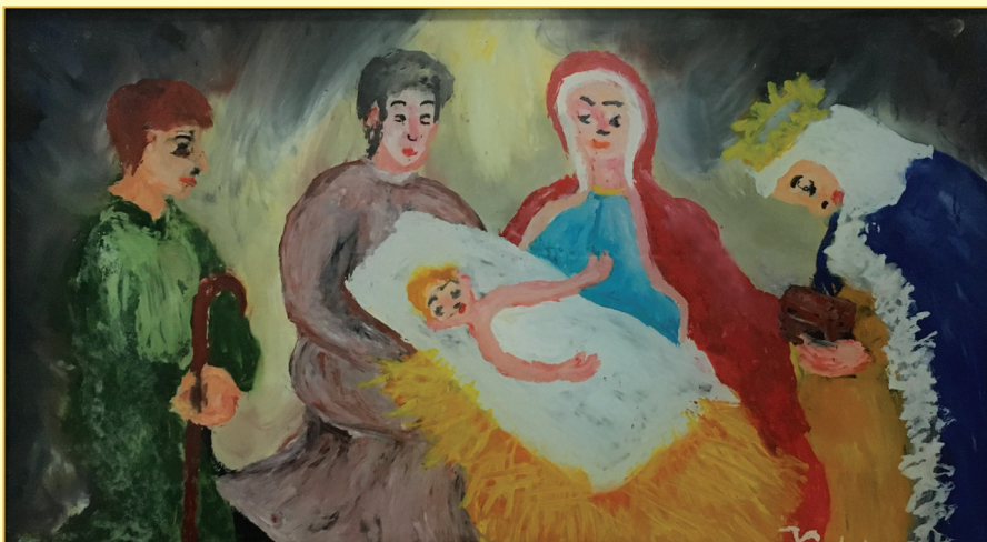
Kordina Vlatka, Koprivnica - Poklonstvo, ulje na staklu, 2016.

zanimanja i djelatnosti s ciljem i namjerom da promovira i potakne oživljavanje jasličke produkcije i da educira javnost i podigne razinu ovog specifičnog oblika likovnog stvaralaštva. Grupa entuzijasta, polazeći od tradicije, povezujući duhovno i materijalno, umjetnički doživljaj s vjerom i nadom, postepeno je rasla i svojim djelovanjem nastojala se predstaviti i približiti kako domaćoj tako i svjetskoj javnosti. Orga-