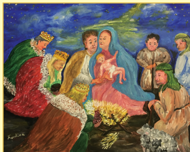
Kordina Vlatka, Koprivnica Rođenje Isusovo, Slika na platnu, 2015.