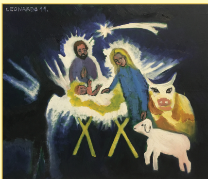
Budimlić Leonardo, Zagreb Rođenje Isusovo, ulje na platnu, 2010.

S tom namjerom osnovana je prije 14 godina (2004.) uz Etnografski muzej u Zagrebu i naša Udruga prijatelja hrvatskih božićnih jaslvice . Uz neke djelatnike muzeja u njoj se okupila manja grupa građana raznih