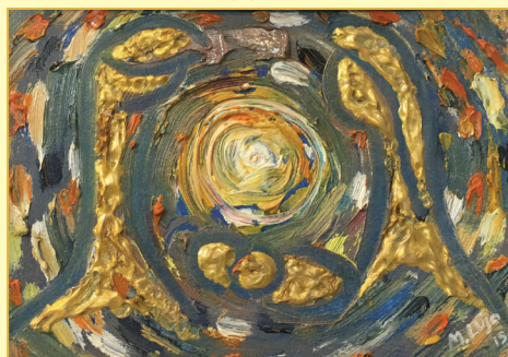
Lujo Marko, Zagreb Sveta obitelj, ulje na kartonu, 2013.