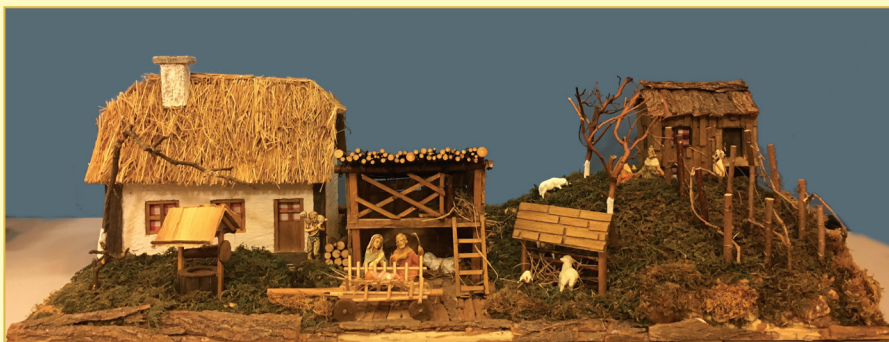
Pavić Krešo, Zagreb - Jaslice vu Prigorju, kombinirana tehnika, 2010.

Sretan Božić svima u Zakladi „Čujem, vjerujem, vidim“, u okrilju odabranih izloženih božićnih jaslina raznih veličina i umješnosti izrade naših vrijednih članova, želi Udruga prijatelja hrvatskih božićnih jaslina iz Zagreba s, poklikom: Sretan i blagoslovljen Božić svima koji prate ovo izlaganje, uz posebnu zahvalu onima koji su bili spremni i željni da se ovo dogodi!