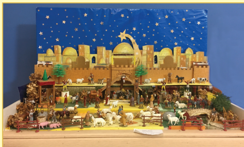
Parac Živko, Zagreb - Kućni Betlehem, razni materijali, kupovne figurice, 2010.